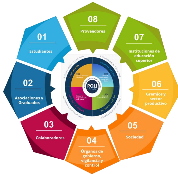
Gráfico grupos de interés.

El Politécnico Gran Colombiano, desde su política de ética y buen gobierno en su versión vigente define los siguientes grupos de interés: